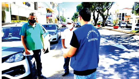
Coronavírus: agentes da Prefeitura fiscalizam cumprimento de regras nos táxis da cidade

Medidas a serem adotadas: Medidas para transporte por táxis: – Realizar limpeza rápida dos pontos de contato com as mãos dos usuários (bancos, maçanetas, portas, pega-mão, puxadores, cinto de segurança e fivela) com álcool líquido 70%; – Manter a disposição, se possível, na entrada e saída do veículo, álcool gel para uso dos clientes; higienização dos equipamentos de pagamento eletrônico a cada viagem – as viagens devem ser realiza-