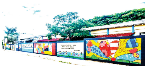
Pintura no muro da Escola Municipal de Ensino Fundamental Ângelo Recla, no distrito de Rio Quartel, no município de Linhares.